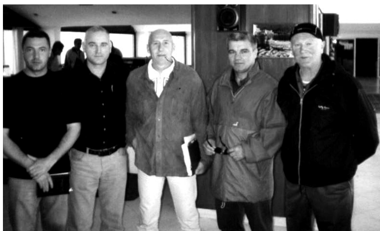
Kongres su pratili i sportski poslenici iz Crne Gore

In recent 250 years, skiing has continuously changed. Lots of different schools have improved it and made it one of the most attractive sports nowadays. All of them, however, have failed to prevent the decrease in popularity of this sport, which took place at the end of 80s and beginning of 90s in the last century. The construction of the new-old skis was the right solution. The carving was born.