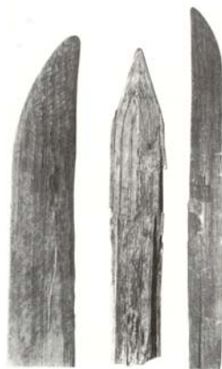
Skije iz Hetinga

Da ovaj istorijski pregled ne bi bio evropeističkog tipa, ne treba zaobići i istaći da postoje i mnogi dokazi o azijskom porijeklu skija, koji dosežu i do tri hiljade godina unazad. Kako ni istoričari još uvijek ne iznose jedinstveno mišljenje, u jedno sa sigurnošću možemo biti sigurni, skijanje se pojavilo gdje god je čovjek osjetio potrebu za njim. Međutim, kolijevka sportskog skijanja je svakako Skandinavija.